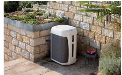
Bild oben In den Beckenkörper integrierte Unterwasserscheinwerfer sorgen bei Bedarf für stimmungsvolles Licht im Pool.